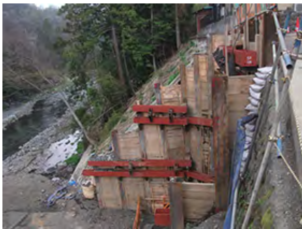
川茂橋下部工設置工事(第1工区)改良工事