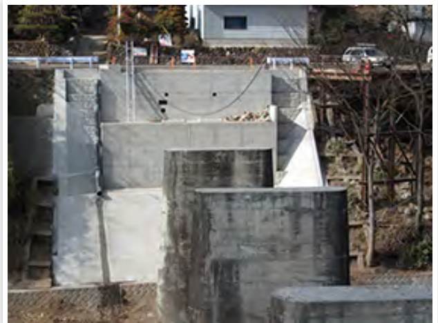
川茂橋下部工設置工事(第1工区)改良工事